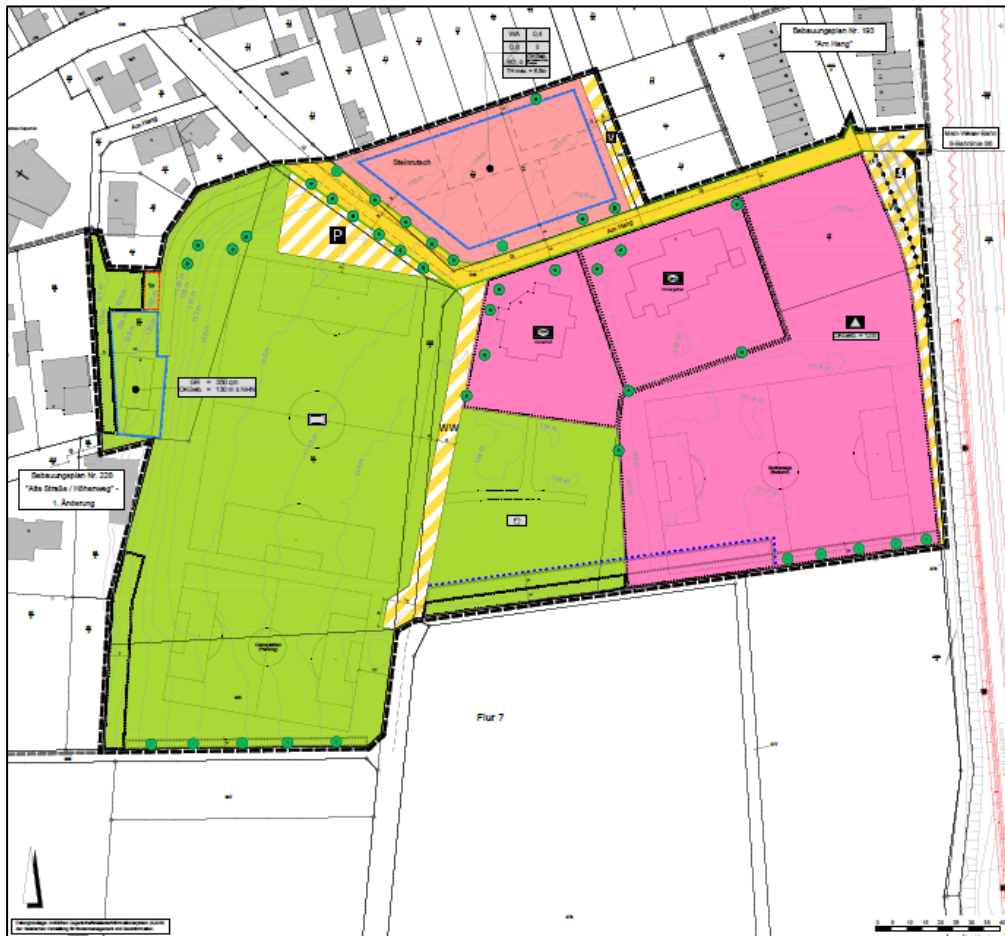
B-Plan Nr. 231 Kindergarten, Schul- und Sportgelände - Am Hang – ohne Maßstab Bauleitplanung der Stadt Karben – FB5 Stadtplanung Bauen Verkehr Wirtschaft Plananlage zu Frühzeitigen Beteiligung – Vorentwurf Planungsbüro Fischer, Wetztenberg