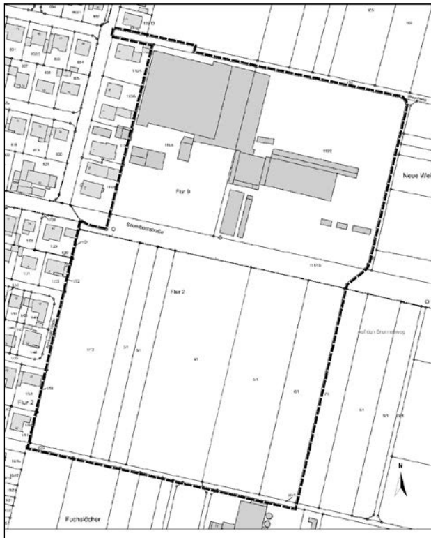
Plananlage (ohne Maßstab) zur frühzeitigen Beteiligung der Öffentlichkeit Entwurf: Planungsgruppe Prof. Dr. V. Seifert GbR, Linden